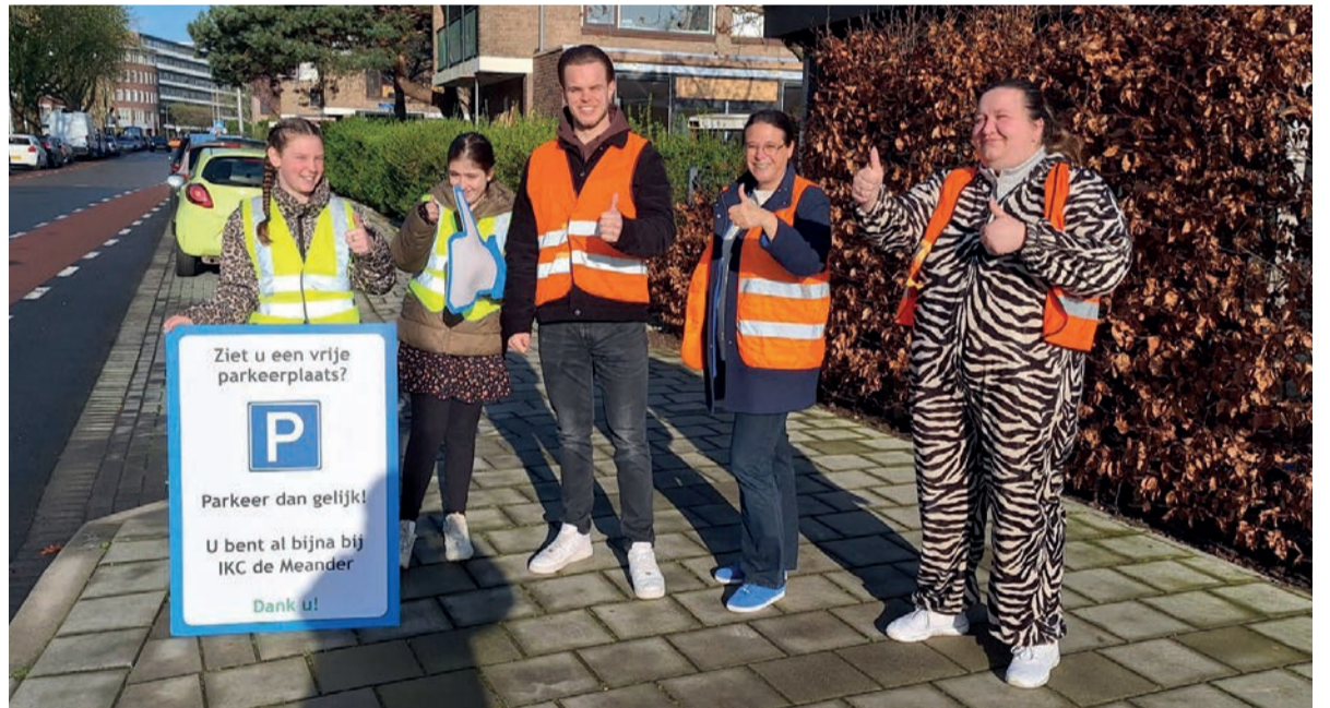
■ Tijdens de actie richten de scholen zich op een veilige omgeving rondom de school. Parkeren de ouders op de juiste plek en rijden zij veilig de juiste straat in? Dan krijgen ze een dikke duim!

De gemeente en de school zijn hier blij mee en roepen de ouders en verzorgers op om zoveel mogelijk lopend en fietsend naar school te komen. Kinderen doen zo verkeerservaring op. Dit is belangrijk, zeker als ze de overstap maken naar het voortgezet onderwijs en zelfstandig een grotere afstand moeten fietsen.