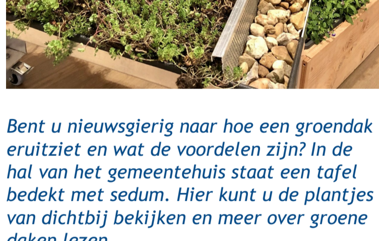
Bent u nieuwsgierig naar hoe een groendak eruitziet en wat de voordelen zijn? In de hal van het gemeentehuis staat een tafel bedekt met sedum. Hier kunt u de planten van dichtbij bekijken en meer over groene daken lezen.