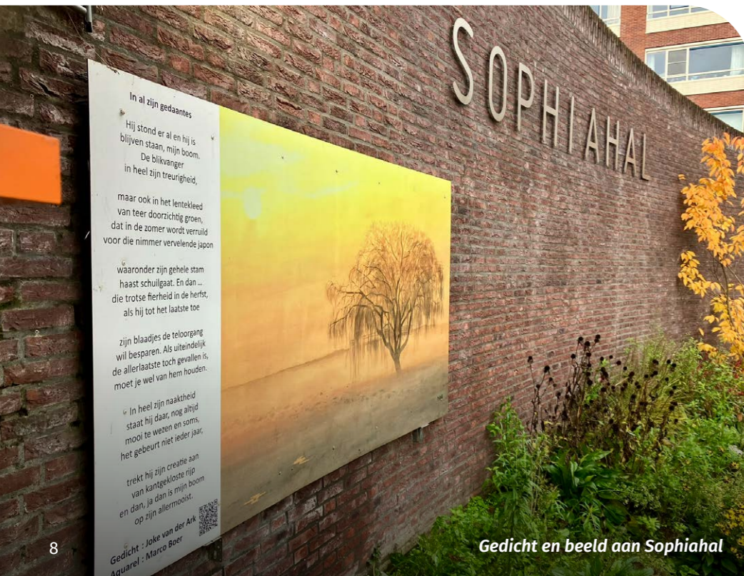
Gedicht en beeld aan Sophiahall

In deze notitie lichten we onze ambities toe op het gebied van cultuur en beschrijven we hoe we deze willen organiseren en ondersteunen. Dit gebeurt in lijn met de doelstellingen van ons lokale preventiebeleid voor het sociaal domein.