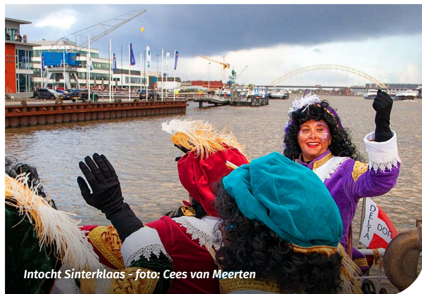
Intocht Sinterklaas

Beeldende kunst is een breed begrip dat veel verschillende vormen van visuele kunst omvat. We moedigen initiatieven aan waarbij (amateur)kunstenaars elkaar ontmoeten en op een creatieve manier hun werk delen. Kunst is op veel plekken en op diverse manieren te bewonderen en te beleven. Denk bijvoorbeeld aan tentoonstellingen en exposities in Cascade en het gemeentehuis, maar ook aan kunst in de openbare ruimte.