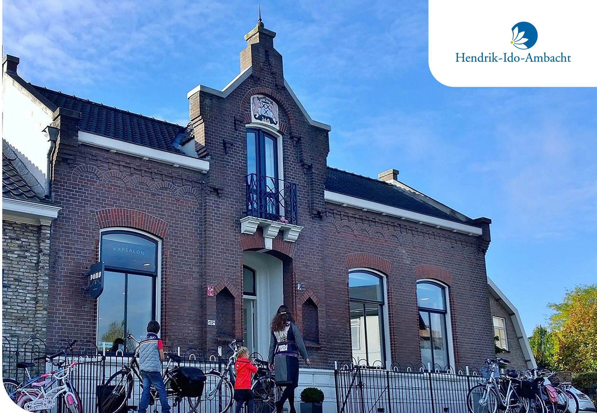
Voormalig gemeentehuis aan de Waal