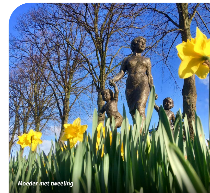
Moeder met tweeling

begrijpen wie niet meedoet, zullen we onderzoeken welke groepen niet bereikt worden en wat de redenen daarvoor zijn. Soms ervaren mensen drempels zoals taalproblemen of financiële, fysieke, mentale of sociale belemmeringen. In dat geval is het belangrijk om te onderzoeken hoe deze drempels verlaagd of weggenomen kunnen worden. Hierin kunnen maatschappelijke organisaties, zoals het Sophia Sociaal Team, Vluchtelingenwerk, Syndion, Yulius, Sociale Dienst Drechtsteden of de Voedselbank een belangrijke rol spelen en hun betrokkenheid is daarom wenselijk.