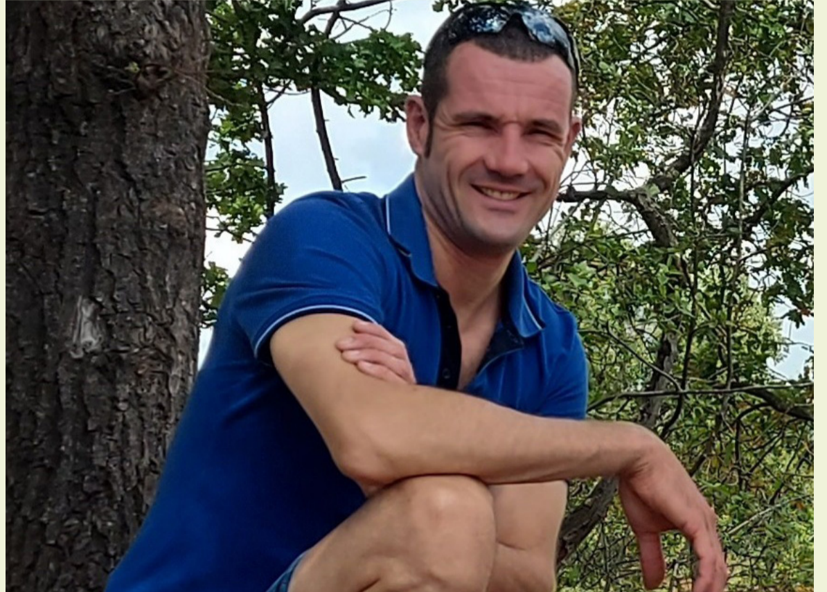
“Na het interview dat in de nieuwsbrief Duurzaam Ambacht verscheen, heb ik positieve reacties gehad uit mijn omgeving. Een tip die ik nog wil meegeven aan mensen die ook zwerfafval willen rapen: neem de milieupas mee zodat u de ondergrondse kliko's kunt openen tijdens uw wandeling. De prikkers kunt u gratis ophalen bij het gemeentehuis.”

Wilt u op de hoogte blijven van nieuws over duurzaamheid? Meld u dan voor onze gratis nieuwsbrief: Hierin delen we nieuws, tips en inspirerende initiatieven van Ambachters op het gebied van duurzaamheid. Ook informeren wij u over bijeenkomsten over aardgasvrij wonen, groepsaankopen en klimaatadaptatie. Een mooie kans om mee te denken en te doen! Wilt u deze ontvangen? Via www.bit.ly/duurzaamhianieuws meldt u zich eenvoudig aan. U kunt zich op ieder moment weer afmelden.