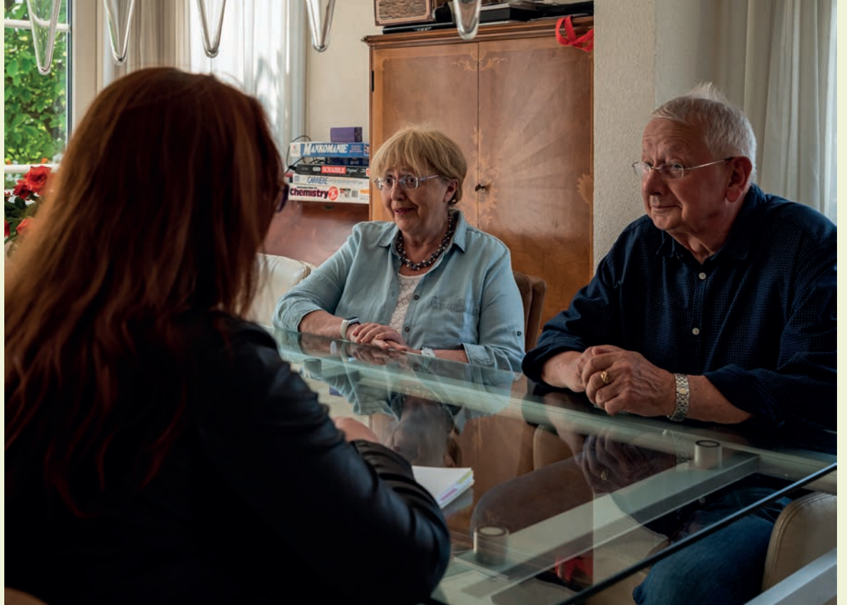
De buurtbemiddelaars van de Sociale Basis proberen burenruzies die een geschil met elkaar hebben weer in gesprek te brengen.

Neem contact op via telefoonnummer 078 750 8900 of per e-mail buurtbemiddeling@desocialebasis.nl .