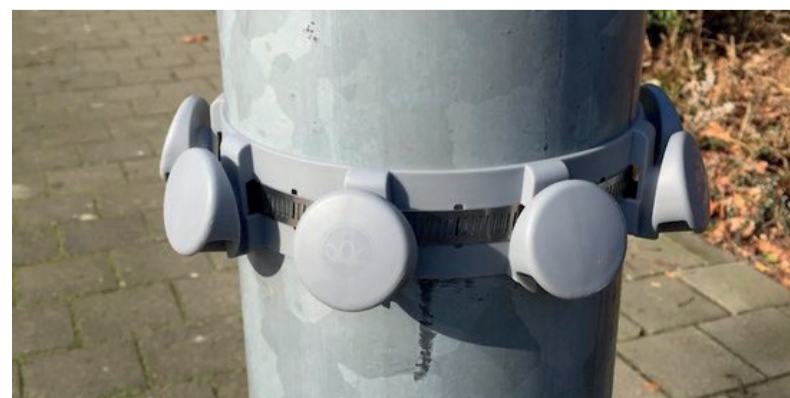
■ Een kroonring aan een lantaarnpaal.

Op maandag 31 oktober is er een inloopmoment. Dan kunt u de kaarten bekijken met de voorlopige locaties van de kroonringen en kunt u vragen stellen. U bent van 16.30 tot 19.30 uur van harte welkom in het gemeentehuis (Weteringsingel 1). De plannen zijn ook digitaal te bekijken op h-i-ambacht.nl/pbdkroonringen . En uw vragen kunt u mailen naar duurzaam@h-i-ambacht.nl .