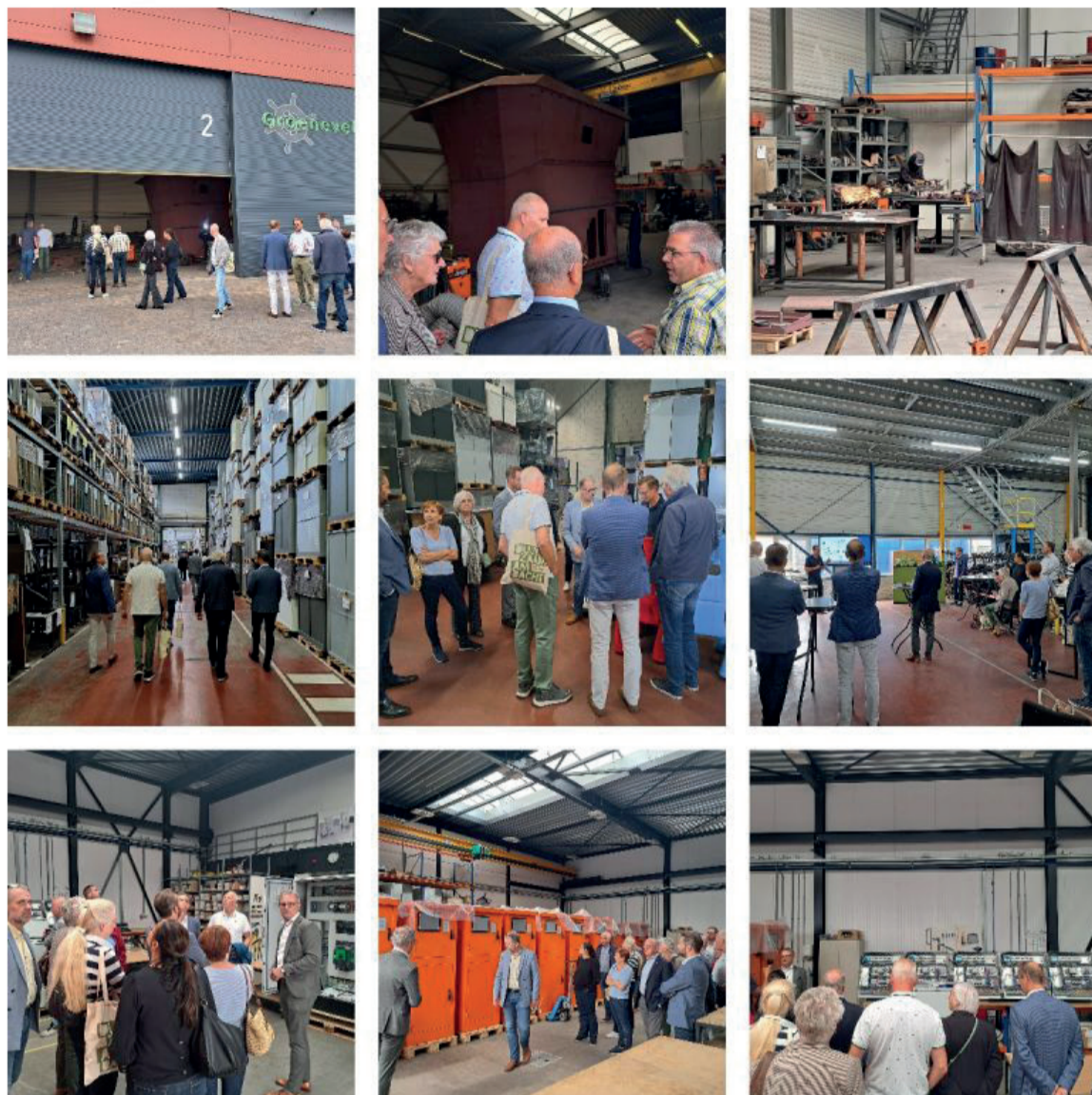
Raads- en collegeleden van de gemeente Hendrik-Ido-Ambacht volgden op dinsdag 4 juli een duurzame bedrijvenroute op bedrijventerrein Antoniapolder. Na het bezoek aan Groeneveldt Marine Construction liep het gezelschap door naar Albeda en tot slot naar VMB Automation. De afsluitende borrel vond plaats bij Il Mercato.