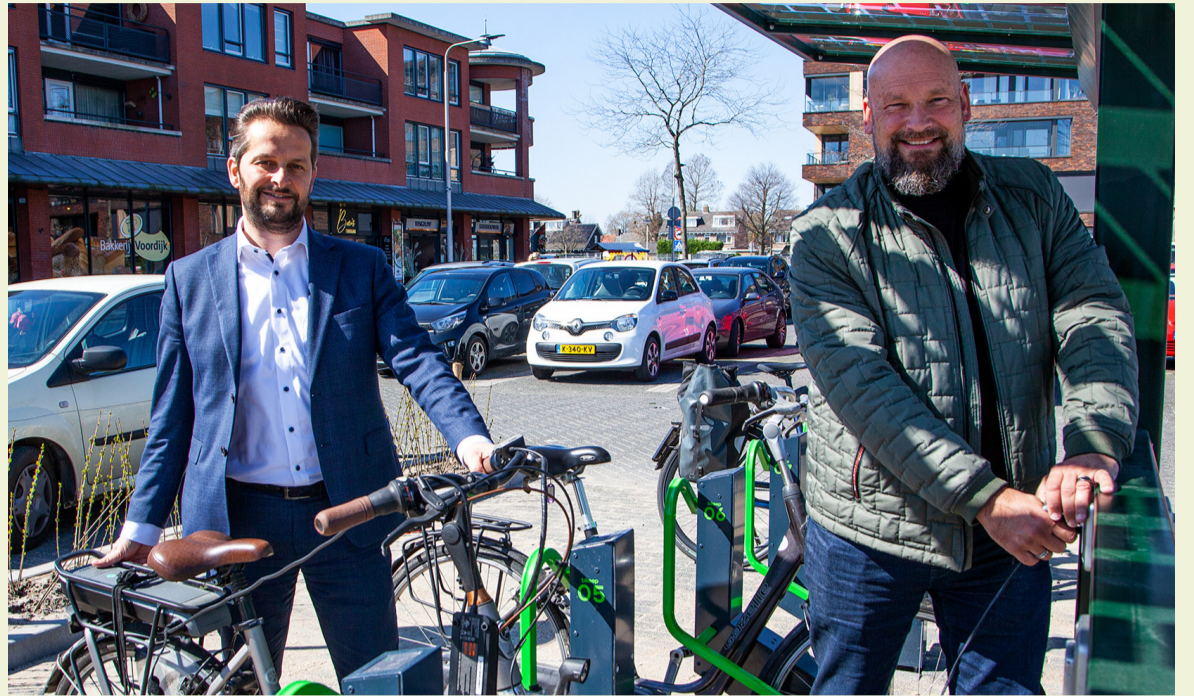
■ Fietsenstalling De Schoof

De slimme fietsenklemmen kunnen vergrendeld worden met een app op de mobiele telefoon. Voor extra toezicht hangen er ook sinds een aantal maanden camera's bij het winkelcentrum. Het stelen van fietsen is daar dus bijna onmogelijk.