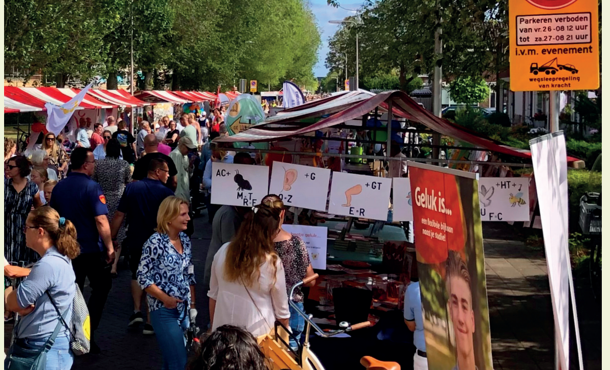
Voor het houden van een evenement is in veel gevallen een vergunning nodig. Vraag deze tijdig aan de gemeente. We hebben tijd nodig om zaken af te stemmen en bijvoorbeeld hulpdiensten te informeren.

We kijken uit naar mooie evenementen en activiteiten, groot en klein, en wensen organisatoren en bezoekers veel plezier!