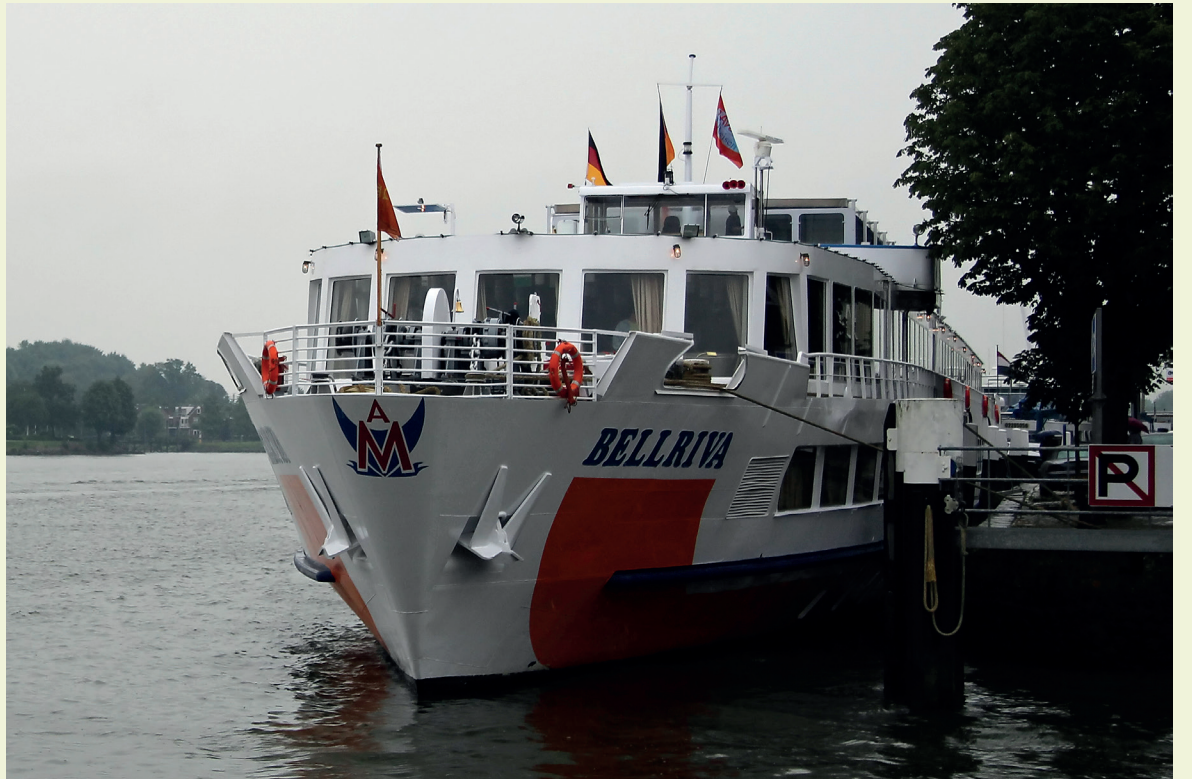
■ MS Bellriva, gebouwd in 1971, kwam als passagiersschip vaak in onze regio. In 2014 lag het schip aan de Dordtse Buiten Walevest.

Het COA kan geen plek bieden aan de vele vluchtelingen die zich wekelijks melden in Ter Apel, dit jaar gaat het om naar verwachting 70.000 asielzoekers. Om te voorkomen dat mensen weer buiten moeten slapen, hebben gemeenten een dringend verzoek van de staatssecretaris ontvangen om extra opvangcapaciteit aan te bieden. Kijk op h-i-ambacht.nl/noodopvang voor meer informatie en veelgestelde vragen. U kunt ook een e-mail sturen aan noodopvang@h-i-ambacht.nl .