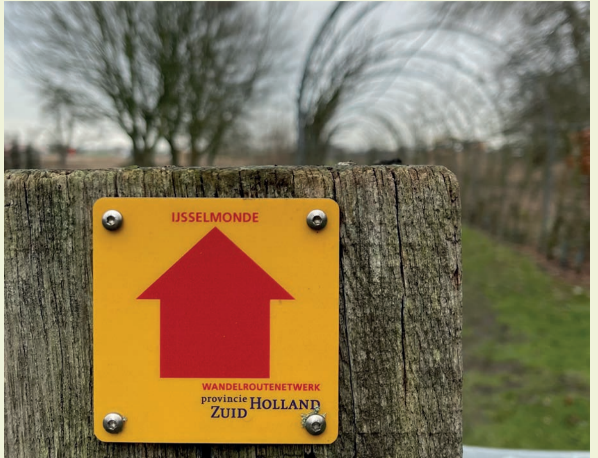
■ Wandelen door of om het Perenlaantje is straks weer volop mogelijk.

Lengte: 550 meter Wandelgebied naast het Perenlaantje: 1,7 hectare Het Laantje als groene strook: 25 meter breed Website: www.hetperenlaantje.nl