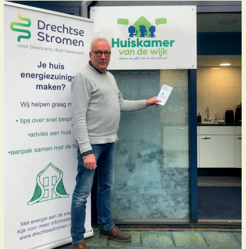
“Welkom op het spreekuur in de Huiskamer van de Wijk en natuurlijk op Drechtsestromen.net!”