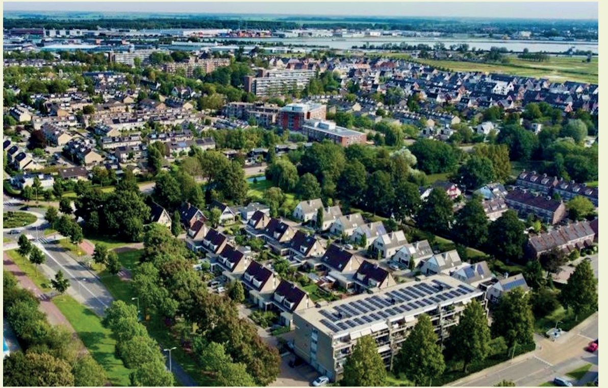
Maar liefst 194 zonnepanelen liggen er op het dak van appartementencomplex De Boetzelaer.