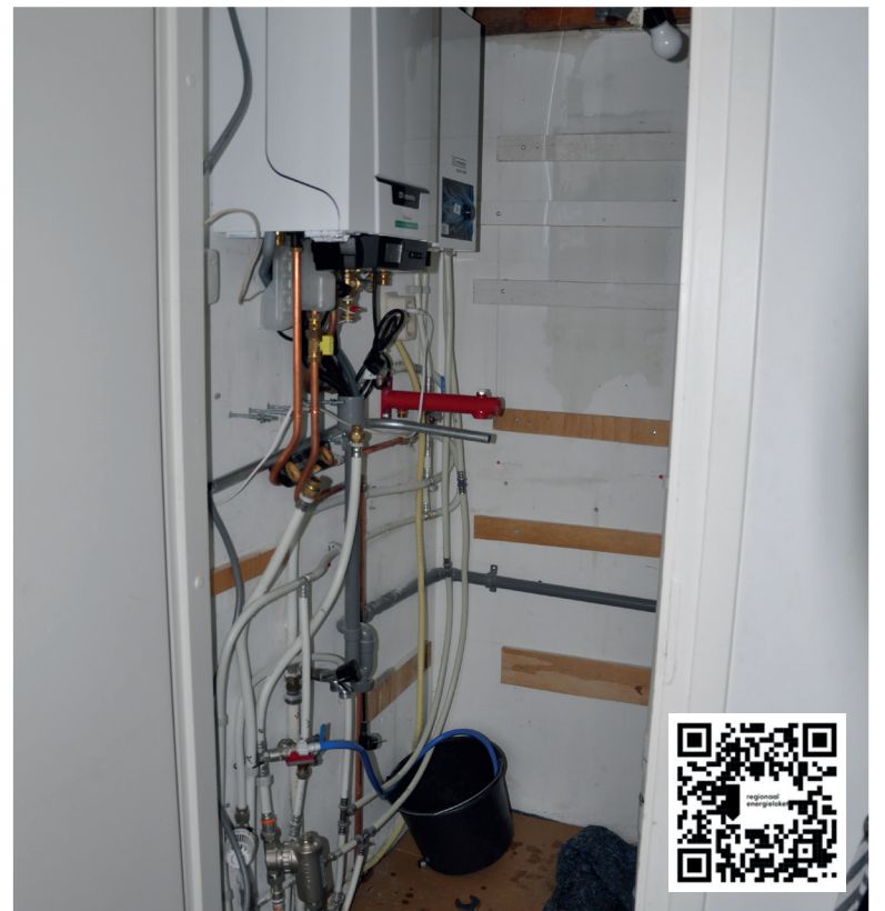
■ Hybride warmtepompen hebben altijd een binnenunit (bijvoorbeeld naast de Cv ketel, zie foto) en meestal een buitenunit.