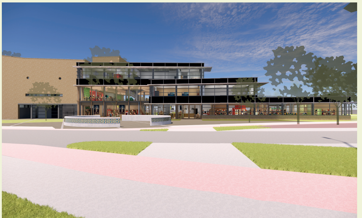
■ Een tekening van hoe een vernieuwd Cascade eruit zou kunnen komen te zien. ©TenBrasWestinga

Hoe laat: 19.00 – 20.30 uur inloop vanaf 18.45 uur