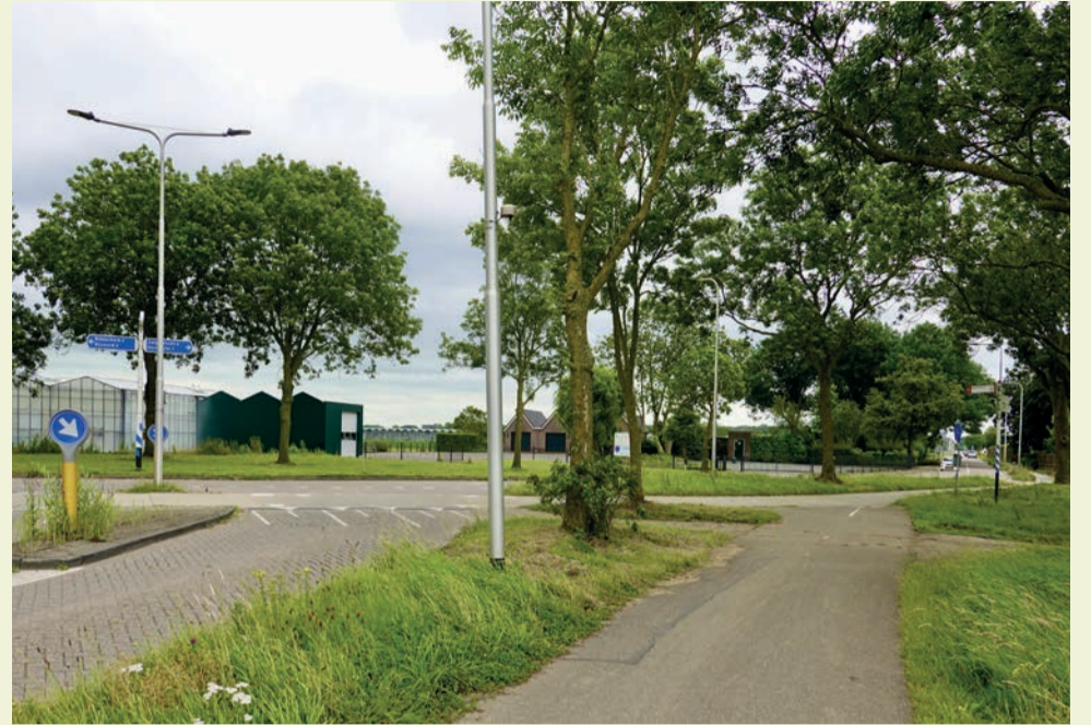
■ Vroeger stond er een tolhuisje op Ambachts grondgebied bij het 'drielandenpunt' van de gemeenten Rijsoord (nu Ridderkerk), Sandelingen Ambacht (nu Hendrik-Ido-Ambacht) en Heerjansdam (nu Zwijndrecht).

De zomervakantie is begonnen! Sommigen gaan ver op reis, anderen blijven in Nederland en weer anderen blijven thuis. Toch kan iedereen een beetje op reis, namelijk op tijdreis.