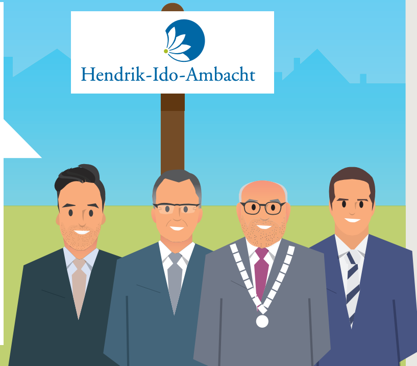
Het college van burgemeester en wethouders

2021 was opnieuw een jaar waarin de coronacrisis een belangrijke plek innam. Maar er werden ook mijlpalen bereikt. Zo ontving de raad een eerste evaluatie van het Preventieplan waaruit bleek dat al veel in gang is gezet. Bij het Waterbusplein werd de eerste paal geslagen. De raad besloot om een ondernemersfonds in te voeren en er werd geld beschikbaar gesteld voor de bouw van vijf nieuwe basisscholen. Ook regionaal waren er grote ontwikkelingen. Zo zijn we onder 'Smart Delta Drechtsteden' de samenwerking aangegaan als het gaat om ambities voor bedrijven, onderwijs en overheid. Ontwikkelingen die bijdragen aan het behoud van onze gemeente en er toe bijdragen dat het in Ambacht prettig wonen en werken is en blijft.