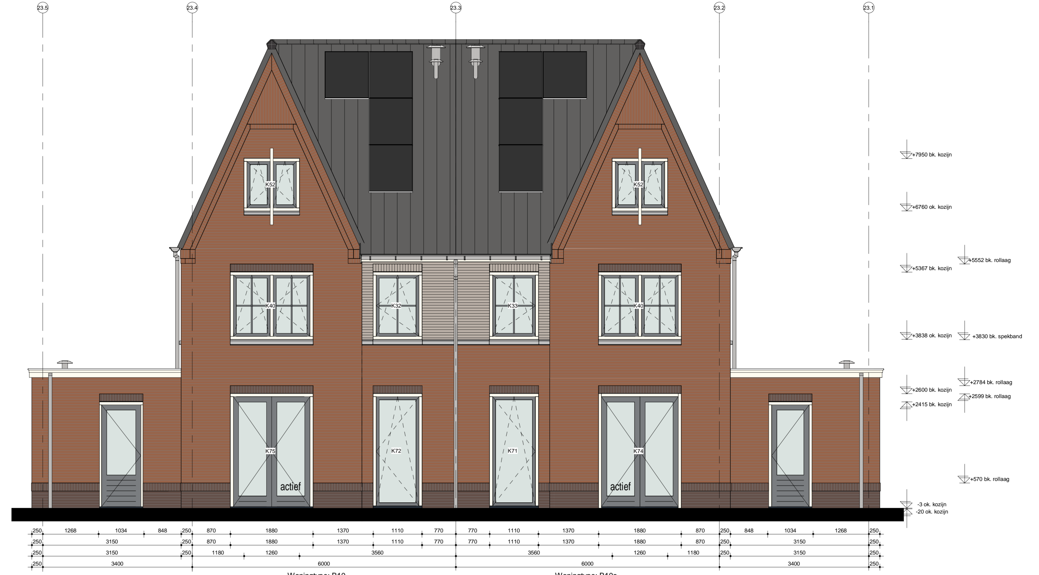
Achtergevel blok 23