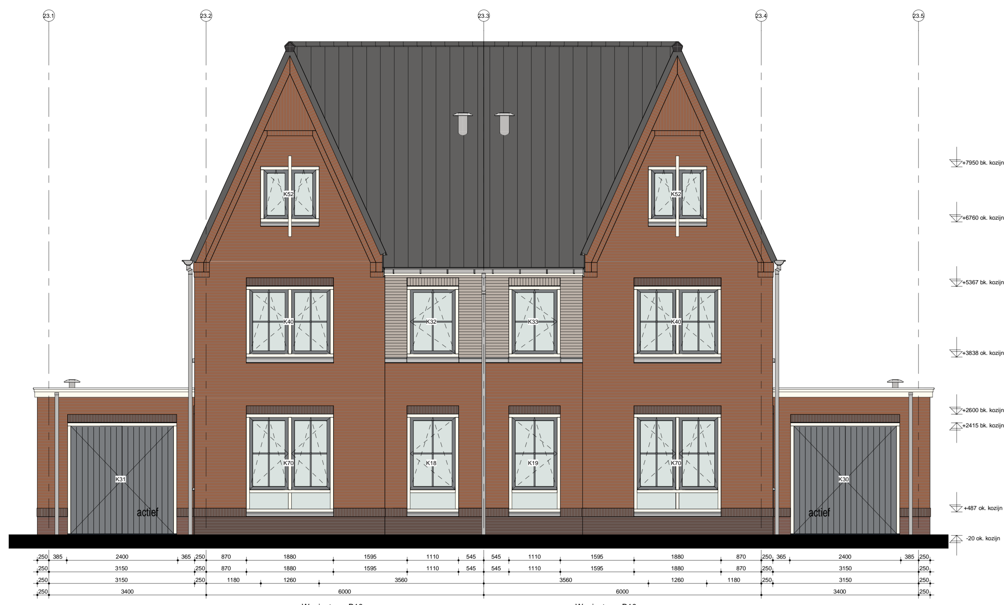
Voorgevel blok 23