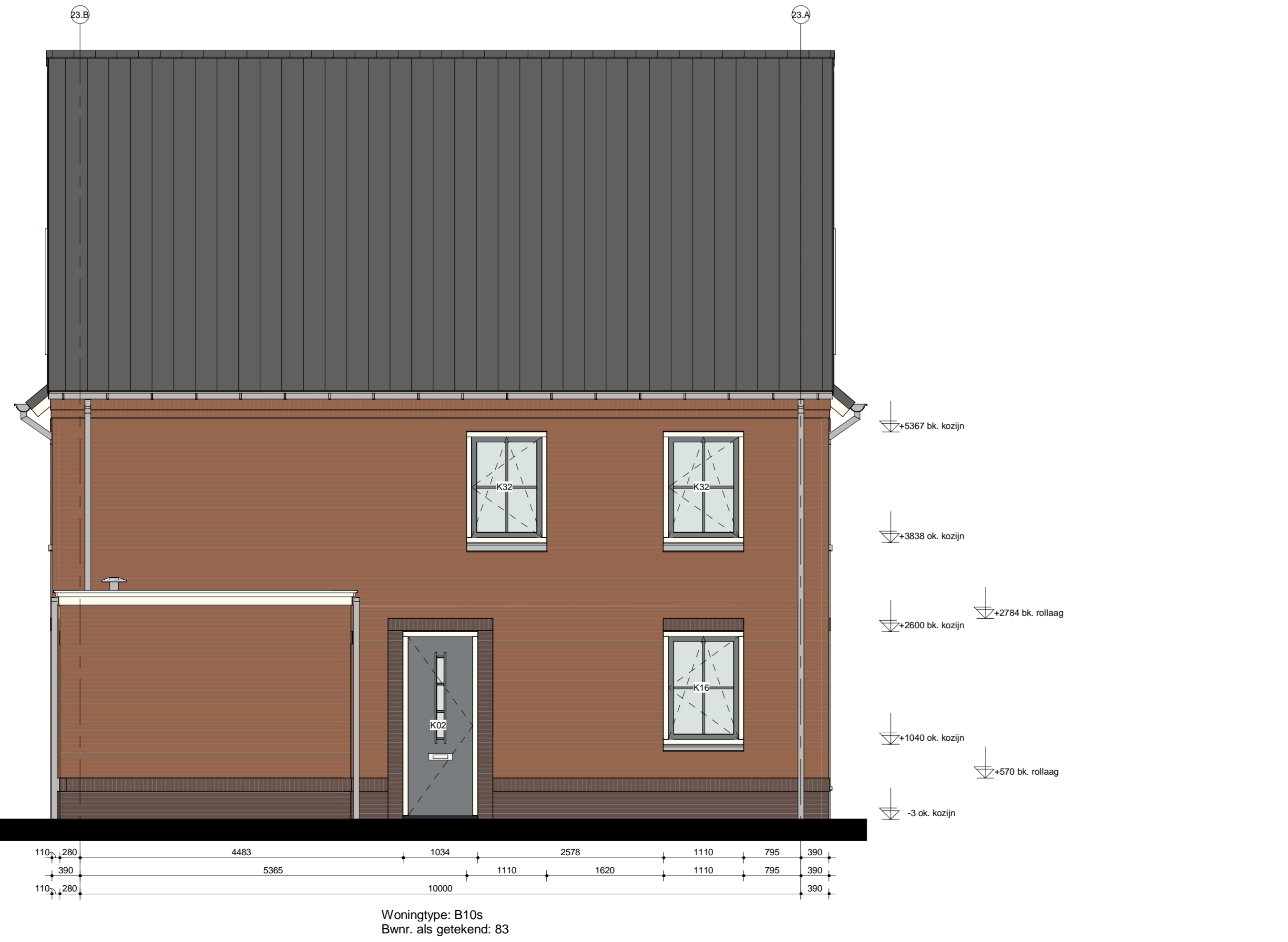
Linkergevel blok 23