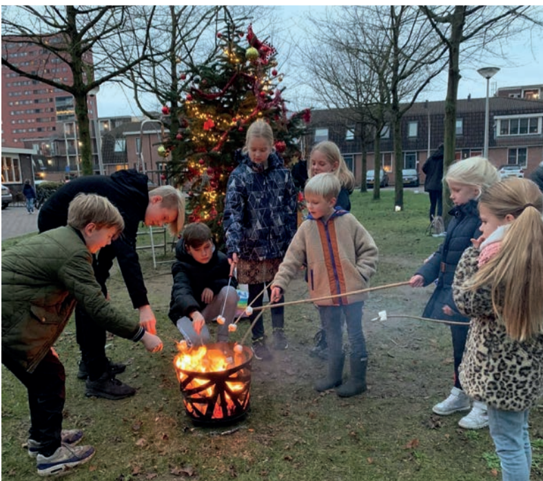
■ Op de achtergrond de winnende kerstboom van 2020.

LET OP: u kunt zich aanmelden tot vrijdag 12 november 2021 en OP=OP.