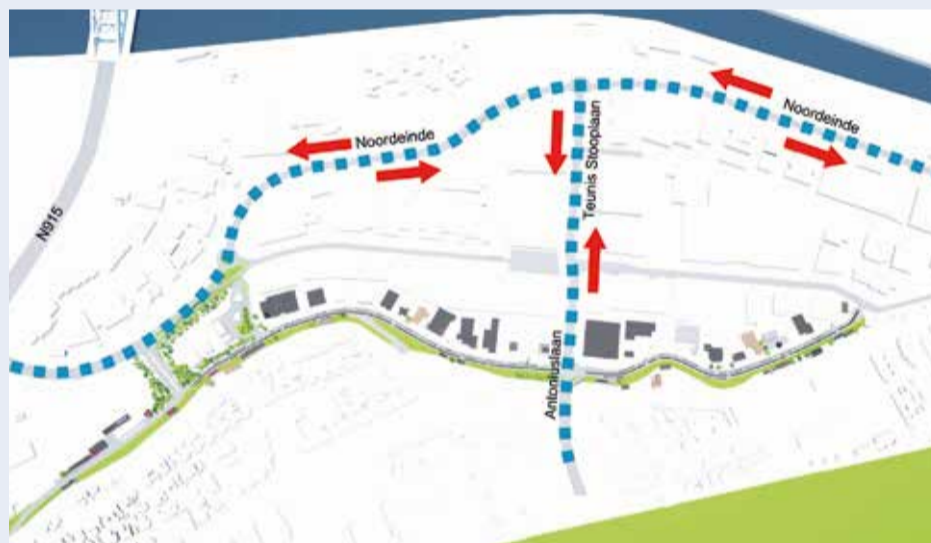
■ Nieuwe route doorgaand verkeer Antoniapolder

Het wordt steeds drukker op de weg. Voor inwoners en ondernemers is het belangrijk dat Hendrik-Ido-Ambacht goed bereikbaar blijft, zowel vanaf de A15, A16 en met openbaar vervoer. Verkeerskundigen hebben goed onderzoek gedaan naar een nieuwe, veilige route voor doorgaand verkeer in de Antoniapolder. Bedrijven en bewoners in het gebied zijn vanaf het begin betrokken bij de plannen. In de oude situatie had het verkeer op de Nijverheidsweg veel last van de vele vrachtwagens die daar laden en lossen. Dit gaat niet samen met het karakter van een doorgaan-