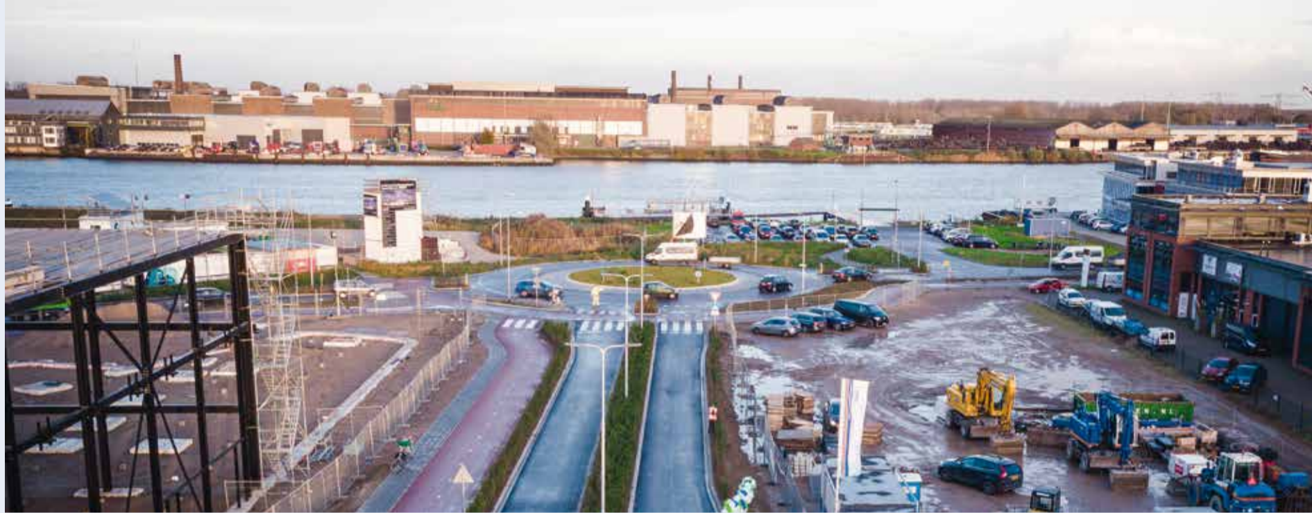
■ Nieuwe rotonde Teunis Stooplaan-Noordeinde

Rijdt u wel eens vanaf de A15 via het Noordeinde, dwars door bedrijventerrein Antoniapolder? Dan zal het u zijn opgevallen dat daar hard gewerkt wordt. Het hele gebied is in ontwikkeling. Er komen nieuwe bedrijfsruimten en er zijn ambitieuze plannen voor het waterbusplein. Om de gemeente vanaf de A15 goed bereikbaar te houden -en andersom- legden we voor doorgaand verkeer een nieuwe route aan over Noordeinde, Teunis Stooplaan en Antoniuslaan. Ook zijn de Nijverheidsweg en Veersedijk heringericht. Vanaf het begin zijn ondernemers en omwonenden in het gebied intensief betrokken bij de plannen door gemeente en de Bouwteams. Doel van deze megaklus: zorgen dat Hendrik-Ido-Ambacht goed bereikbaar blijft èn aantrekkelijk is en blijft voor de huidige en nieuwe bedrijven. In deze special geven we u een toelichting.