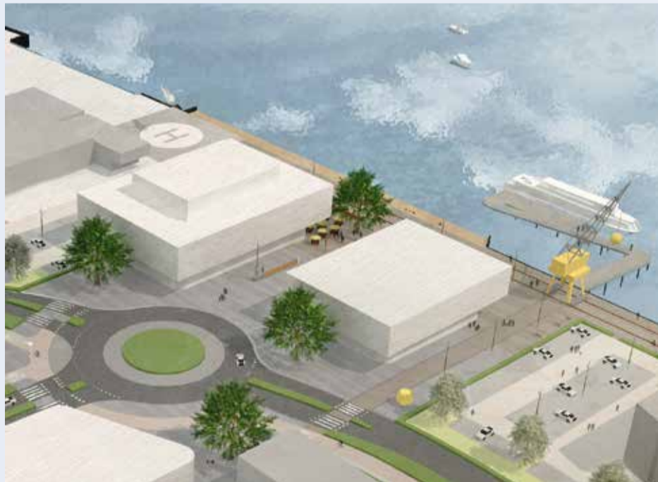
■ Artist impression waterbusplein

Het waterbusplein ligt er nu nog wat verlaten bij. Hier zijn plannen voor horeca, ruimte om te sporten en een maritiem ondernemershuis. Het wordt een levendig plein aan de rivier, waar straks voor inwoners en ondernemers iets te beleven valt. Dit is ook belangrijk voor de sociale veiligheid in de Antoniapolder.