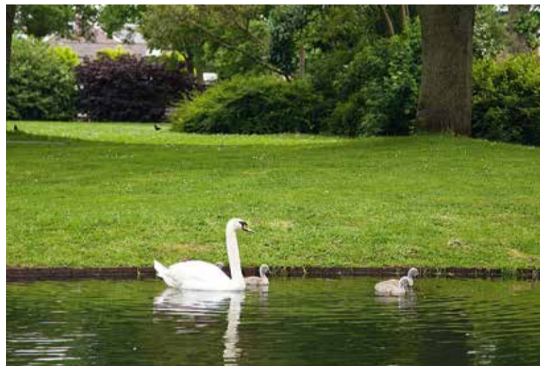
Zwanen houden van rust

Het broedseizoen is weer begonnen en op diverse plaatsen in Hendrik-Ido-Ambacht zijn er zwanen die op hun eieren broeden. Dit gebeurt op een nest in of op de oevers van het water of op de grond. Het vrouwtje blijft in principe op het nest, totdat de kuikens uit de eieren komen. Het mannetje zorgt voor het eten.