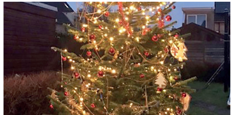
Bewoners van de Abraham van Strijstraat versierden de buurtkerstboom met veel zelfgemaakte knutselwerkjes en voer voor vogels. Zij winnen dit jaar de prijs, allerlei lekkernijen voor de hele straat.