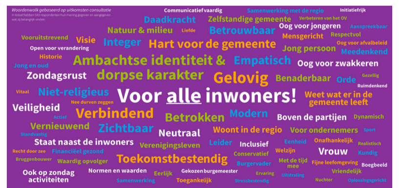
In de profielschets: een woordwolk met zaken waar de nieuwe burgemeester volgens Ambachtters aandacht aan moet besteden.

Belangstellenden kunnen hun sollicitatiebrief – gericht aan Zijne Majesteit de Koning – zenden aan de commissaris van de Koning in Zuid-Holland. De brief moet uiterlijk op dinsdag 9 mei 2023 binnen zijn. Het kabinet van de commissaris van de Koning geeft graag informatie over de vacature en is bereikbaar via burgemeestersinfo@pzh.nl .