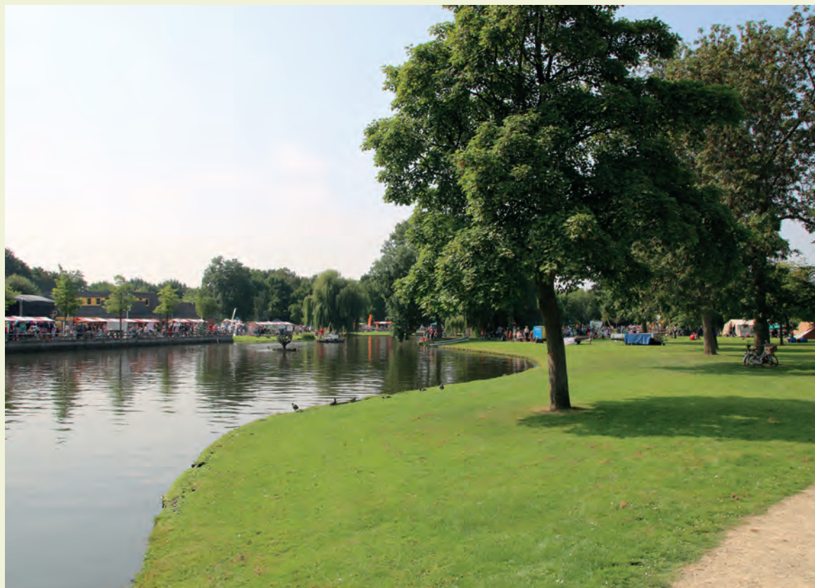
■ De Zomerparkdag, een dag om elkaar te ontmoeten en te genieten van alles wat Gewoon Ambachts is!

Op zaterdag 31 augustus vindt de 17e editie van de Zomerparkdag plaats. Het jaarlijkse evenement waarop we onze vrijwilligers bedanken voor hun inzet. Wilt u misschien ook als vrijwilliger aan de slag of lid worden van een vereniging of organisatie? Neem dan vooral een kijkje bij de verenigingen en organisaties die zich presenteren op deze dag. Of kijk gewoon rond wat Ambacht allemaal te bieden heeft.