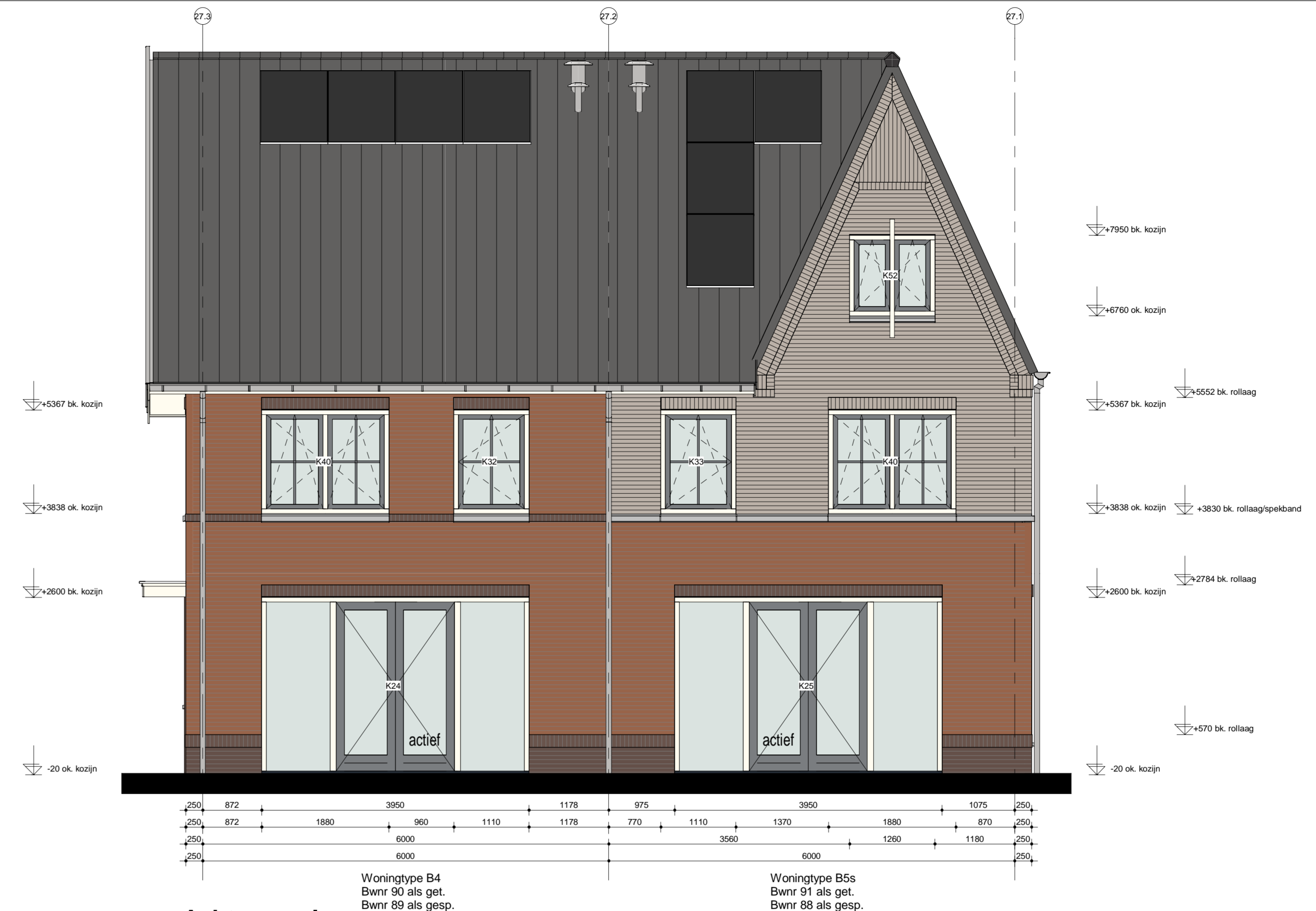
Achtergevel blok 27 als getekend blok 26 als gespiegeld

Woningtype B5s Bwnr 91 als get. Bwnr 88 als gesp. Woningtype B4 Bwnr 90 als get. Bwnr 89 als gesp.