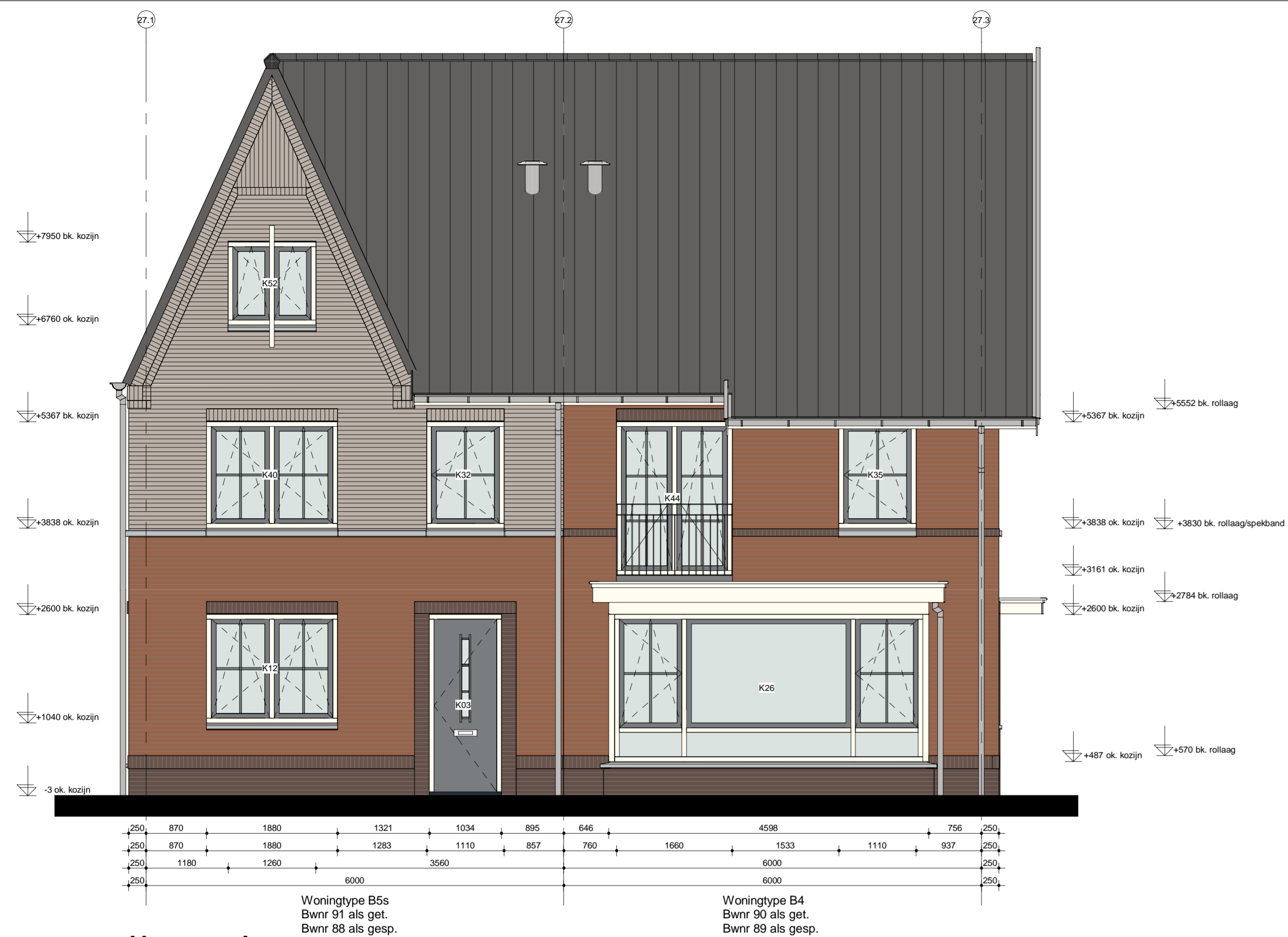
Voorgevel blok 27 als getekend blok 26 als gespiegeld

Woningtype B5s Bwnr 91 als get. Bwnr 88 als gesp. Woningtype B4 Bwnr 90 als get. Bwnr 89 als gesp.