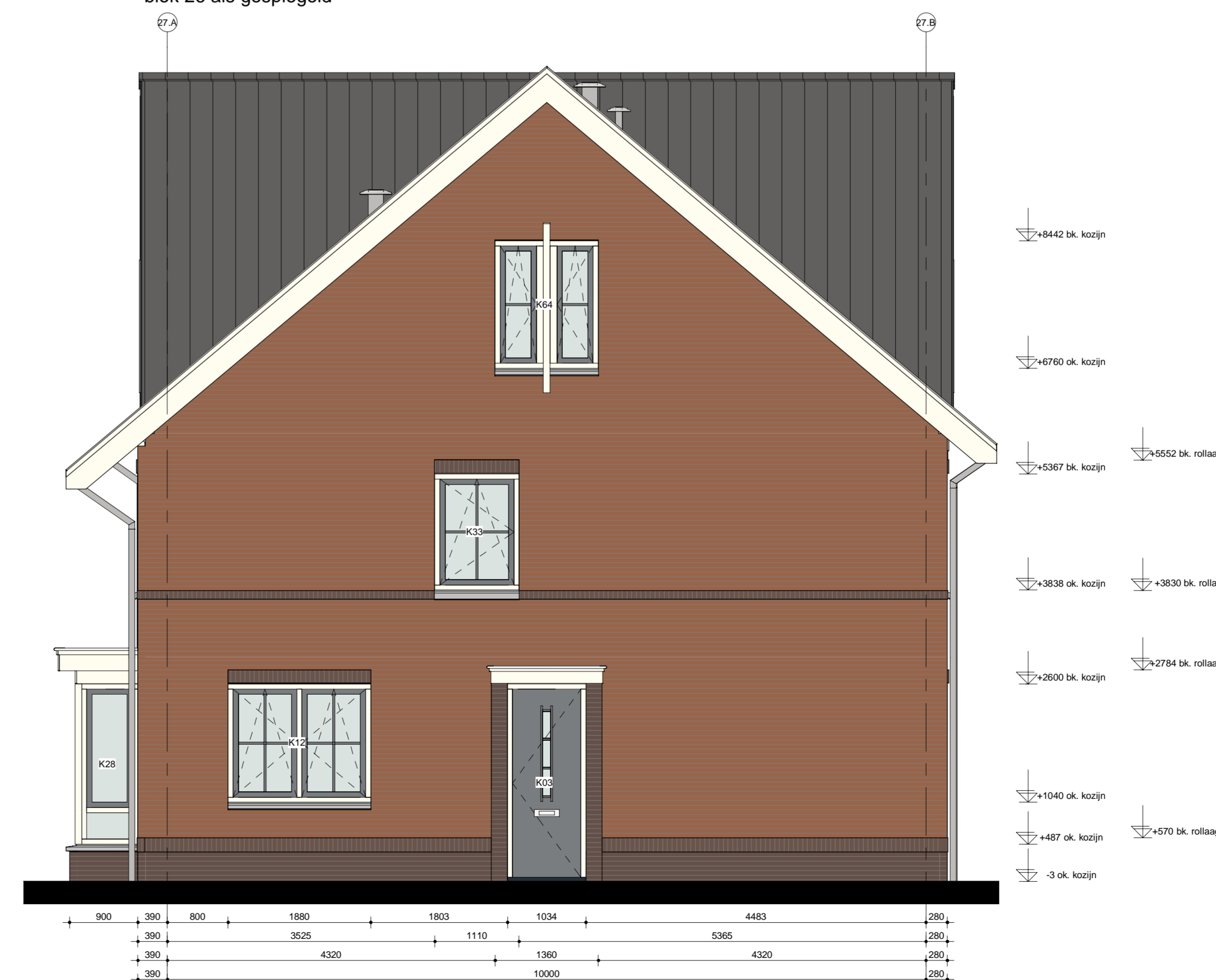
Rechterevel blok 27 als getekend blok 26 als gespiegeld

Woningtype B5s Bwnr 91 als get. Bwnr 88 als gesp.